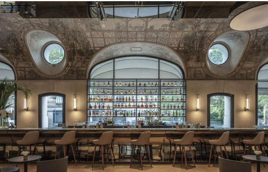
Hôtel Lutetia, 45 Boulevard Raspail (Paris 6). Tél. +33 1 49 54 46 00. www.hotellutetia.com