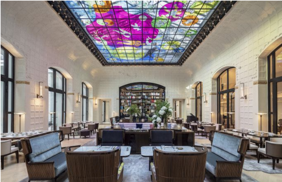
Hôtel Lutetia, 45 Boulevard Raspail (Paris 6). Tél. +33 1 49 54 46 00. www.hotellutetia.com