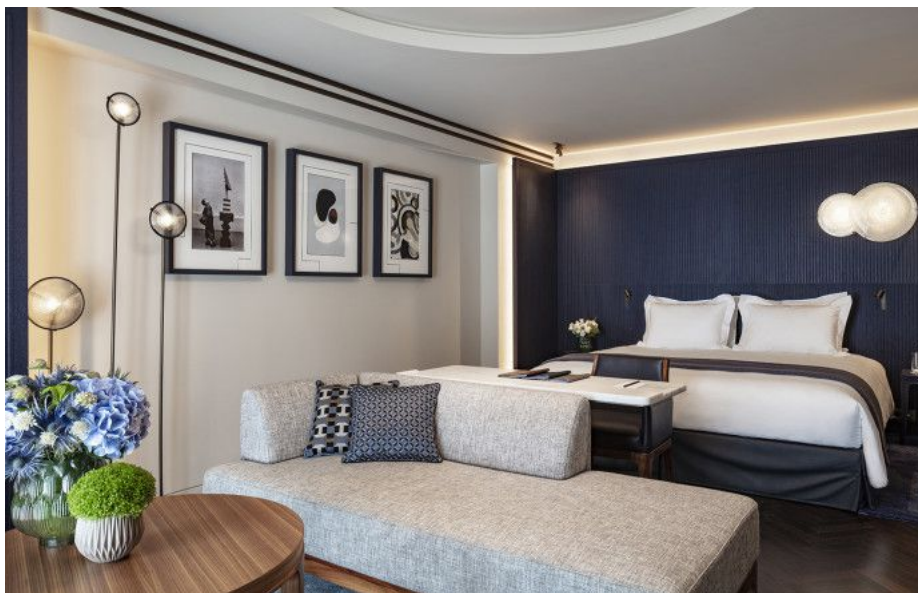
Hôtel Lutetia, 45 Boulevard Raspail (Paris 6). Tél. +33 1 49 54 46 00. www.hotellutetia.com