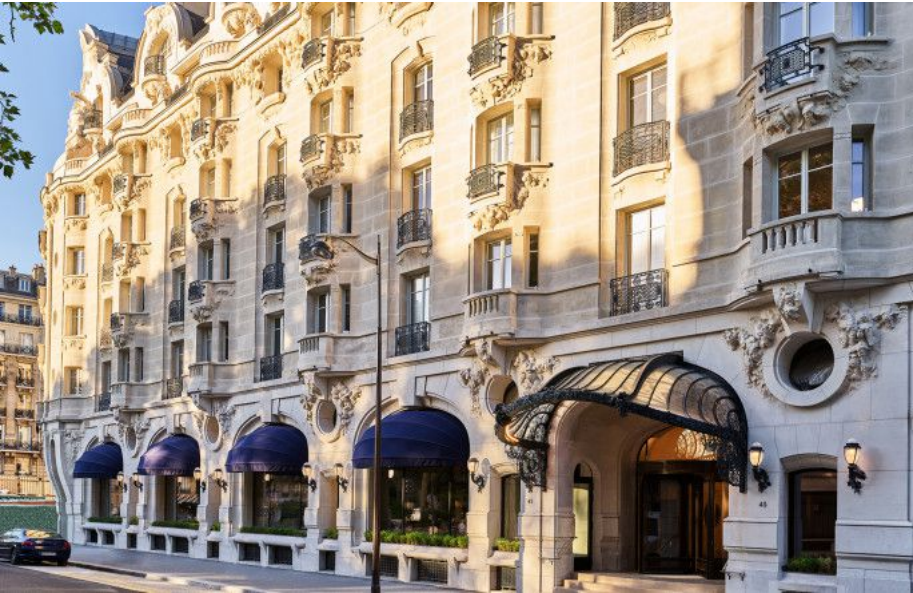
Hôtel Lutetia, 45 Boulevard Raspail (Paris 6). Tél. +33 1 49 54 46 00. www.hotellutetia.com