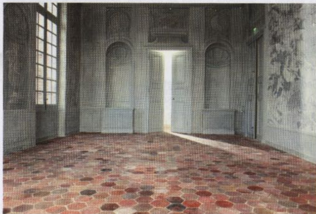
La dernière campagne de restauration a permis de mettre en valeur un décor peint de Brunetti dans l'antichambre de la marquise Voyer d'Argenson.

Mais c'est évidemment à l'intérieur que le travail de retour en arrière est le plus révélateur. Il s'échelonne en trois campagnes, 2006, 2009 et 2014, la dernière inaugurée en septembre dernier. D'une manière très pédagogique, elles illustrent une montée en puissance du fantasme Louis XV : d'abord modérée, la restitution se fait plus appuyée, pour aboutir enfin à des recreations. Seul point commun : ces opérations sont conduites alors qu'il n'y a toujours pas de programme, faisant parfois du maître d'œuvre un maître d'ouvrage qui ne dit pas son nom. Que va-t-on faire de ce château sans meubles et sans collections, qu'on visite d'ailleurs avec une certaine difficulté ?