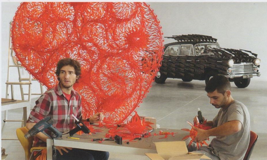
Les étudiants de la filière Métiers de la culture de l'IESA, lors d'une visite à l'atelier de Joana Vasconcelos à Lisbonne.